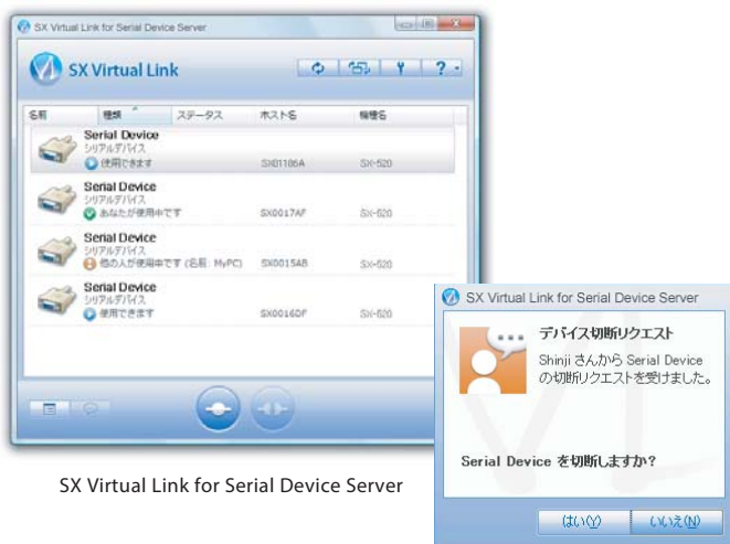
SX Virtual Link for Serial Device Server

实现串口虚拟化的应用软件。将您的RS-232C设备连接到串口设备服务器后，通过在PC上使用该软件，您可以从PC 远程连接到这些RS-232C设备。由于本软件通过网络实现虚拟连接，即使在没有串口的PC上也可以通过串口连接使用RS-232C设备。